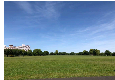
自由の広場 都内とは思えない大きな原っぱがあり、かけっこ教室や星空観察会など季節のイベントも行っています。