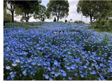
大花壇のネモフィラボランティアの花壇管理によりネモフィラ、コキアやバラなどが楽しめます。公式YouTubeで動画を公開中です。