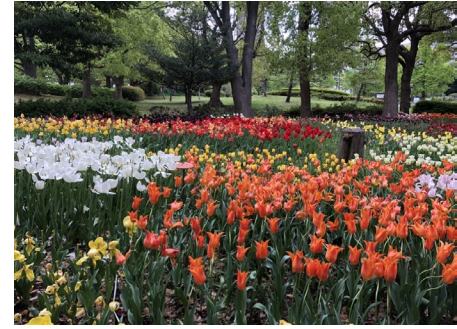
チューリップの杜 約1万本のチューリップが開花。 公式YouTubeで動画を公開中です。