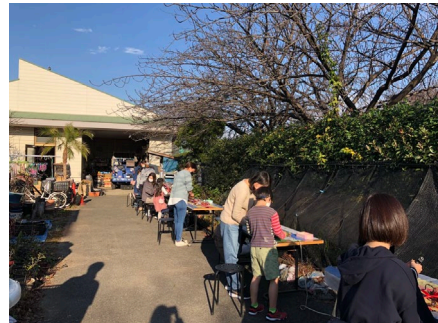
季節のワークショップ 園内で剪定した発生材を使って季節に合わせたワークショップを開催しています。