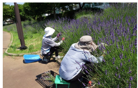
ハーブボランティア ハーブガーデンを育成しており ラベンダーの配布会を行ったり 掲示物を作成したり公園を 彩ってくれています。