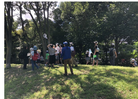
自然観察会 荒川区の講師をよんで 自然観察会を行っています。 様々なリーフレットも センターにて配布中です。