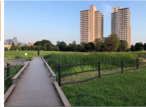
トンボ池・湿地 トンボの貴重な生息地として 野鳥や昆虫など 自然を満喫できる 憩いの場となっています。