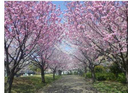
プロムナードのサクラ 約30本のカンザンの桜並木です。 穴場スポットとして有名です。