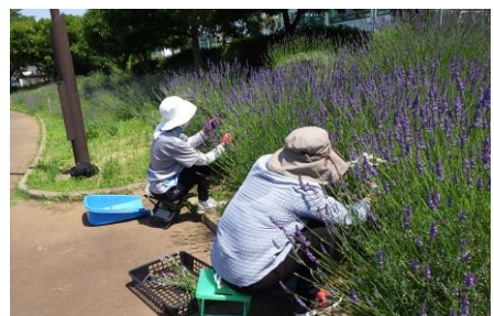
ハーブボランティア ハーブガーデンを育成しており ラベンダーの配布会を行ったり 掲示物を制作したり公園を 彩ってくれています。