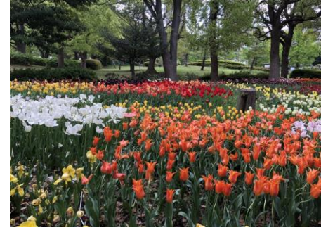
チューリップの杜 約1万本のチューリップが開花。 公式YouTubeで動画を公開中です。