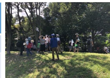
自然観察会 荒川区の講師をよんで 自然観察会を行っています。 様々なリーフレットも センターにて配布中です。