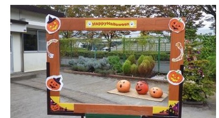
巨大かぼちゃ展示 サービスセンター内にて 常陸大宮市の農家と連携して 巨大かぼちゃを頂き、 ハロウィーンの装飾を行いました。