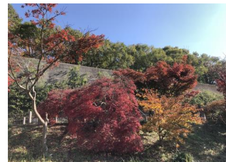
園内のモミジ 100品種を超えるカエデ類や イチョウが秋には きれいに色づきます。