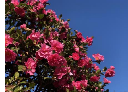
サザンカの名所 園内には50種4000本のサザンカがあり、植栽地復元に向けてセンター裏でも育成中です。