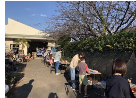
季節のワークショップ 園内で剪定した発生材を使って季節に合わせたワークショップを開催しています。