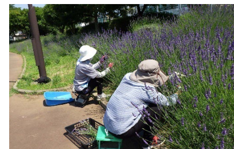
【ハーブボランティア】 ハーブガーデンを管理しており、 ラベンダーやハーブ・ポット苗の 配布会を行ったり、掲示物を制作 するなどして公園を彩って くれています。