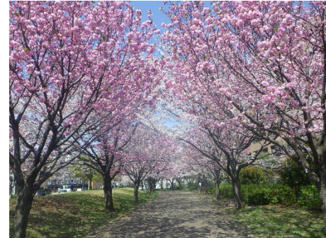
【プロムナードのサクラ】 約30本のカンザンの桜並木です。 穴場スポットとして知られています。