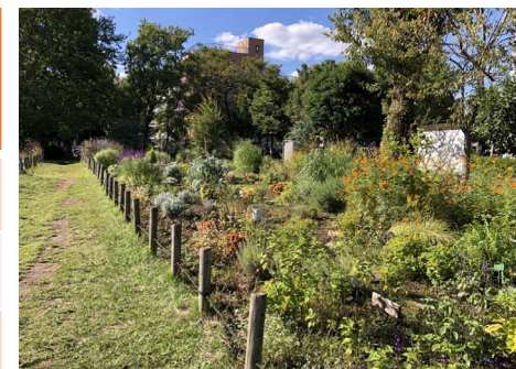
園内の花壇・ガーデン 園内のハーブガーデンや 花壇などはボランティアが 管理しています。 園内の風景を彩ってくれています。