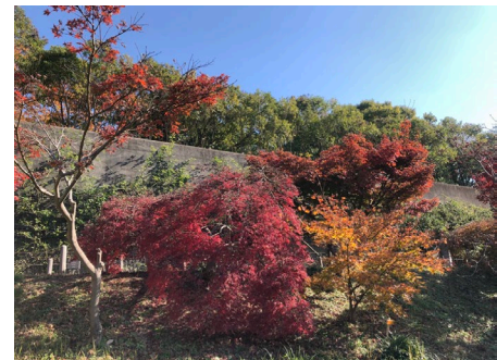
園内のモミジ 100品種を超えるカエデ類や イチョウが秋には きれいに色づきます。