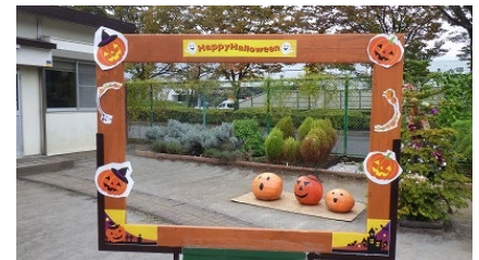
巨大かぼちゃ展示 サービスセンター内にて 常陸大宮市の農家と連携して 巨大かぼちゃを頂き、 ハロウィーンの装飾を行いました。