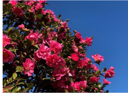
【サザンカの名所】 園内には50種4000本のサザンカがあり、植栽地復元に向けてサービスセンター裏でも育成中です。サービスセンターにて、サザンカマップも配布しております。