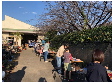
【季節のワークショップ】 園内で剪定した発生材を使って季節に合わせたワークショップを定期的開催しています。