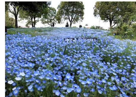
【大花壇のネモフィラ】ボランティアさんの花壇管理によりネモフィラ、菜の花、ひまわり、コキアやバラなどが楽しめます。公式YouTubeで動画を公開中です。