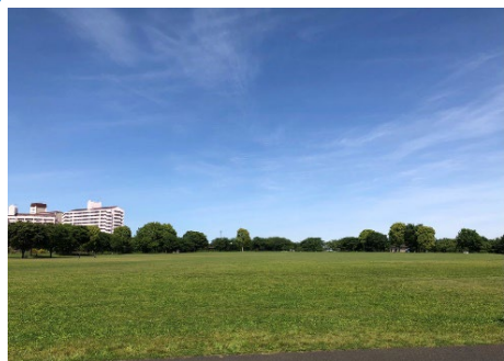
【自由の広場】都内とは思えない大きな原っぱがあり、かけっこ教室やどんぐりイベント、星空観察会など季節のイベントも行っています。