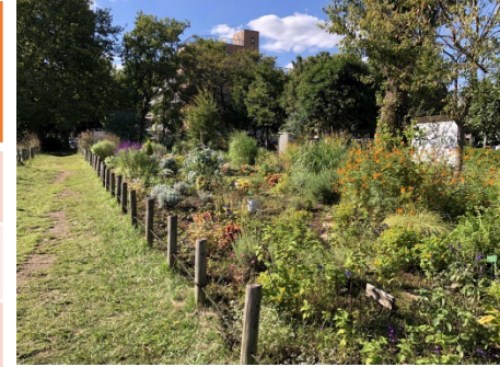
【園内の花壇・ガーデン】 園内のハーブガーデンや花壇などはボランティアの皆さんが日々管理しています。四季を通じて園内の景色に彩りを添え、来園者が楽しめるようにしていきます。