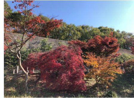
【園内のモミジ】 秋には100品種を超えるカエデ類やイチョウが綺麗に色づきます。令和6年度にはもみじの観察会に合わせて「もみじライトアップ」も開催しました。