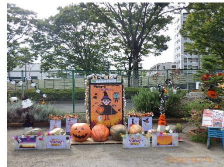
【季節の顔出しパネル】 サービスセンター敷地内にて季節に合わせた顔出しパネルを設置しています。9～10月には常陸大宮市の農家さんと連携してお化けかぼちゃでハロウィンの装飾を行いました。その他季節のイベントも開催しています。